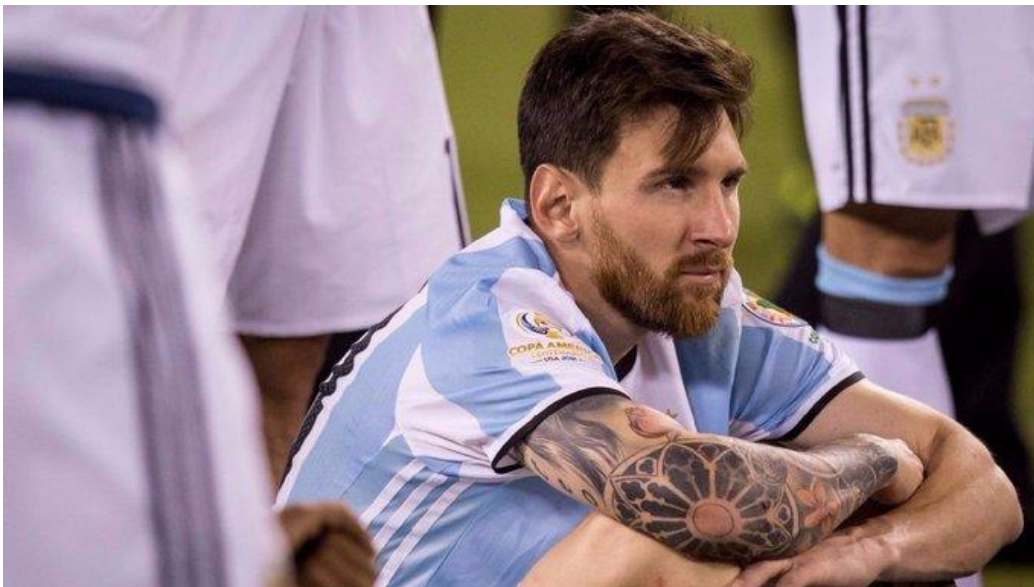
Lionel Messi kristlike sugemetega tätoveeringud