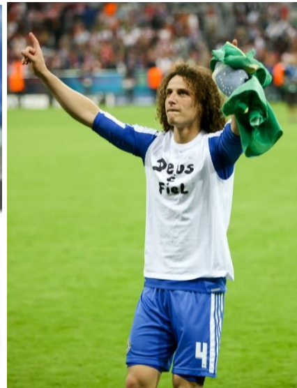
Jumala atleedid Edinson Cavani ja David Luiz