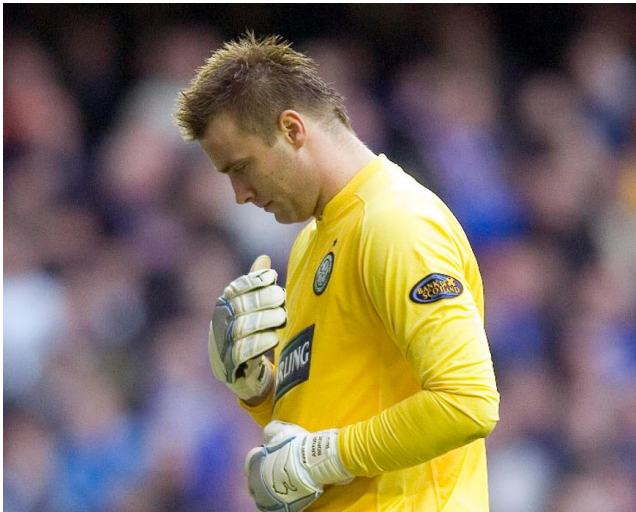
The Holy Goalie ehk Artur Boruc ristimärki tegemas (Twitter)

Poola väravavaht Artur Boruc sai Glasgow' Celticu fännidelt hüüdnime The Holy Goalie ehk Püha väravavaht kuna teeb mängude ajal avalikult ristimärki. 10